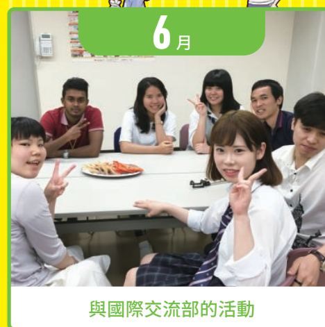
與國際交流部的活動