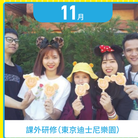
課外研修(東京迪士尼樂園)