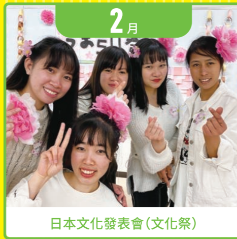
日本文化發表會(文化祭)