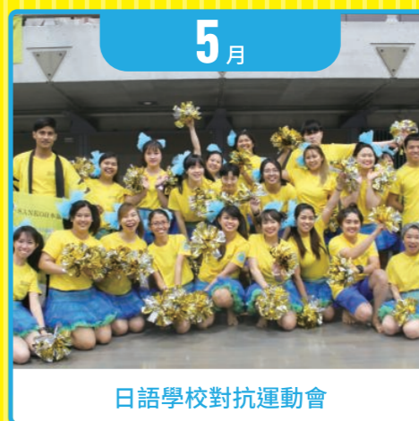
日語學校對抗運動會